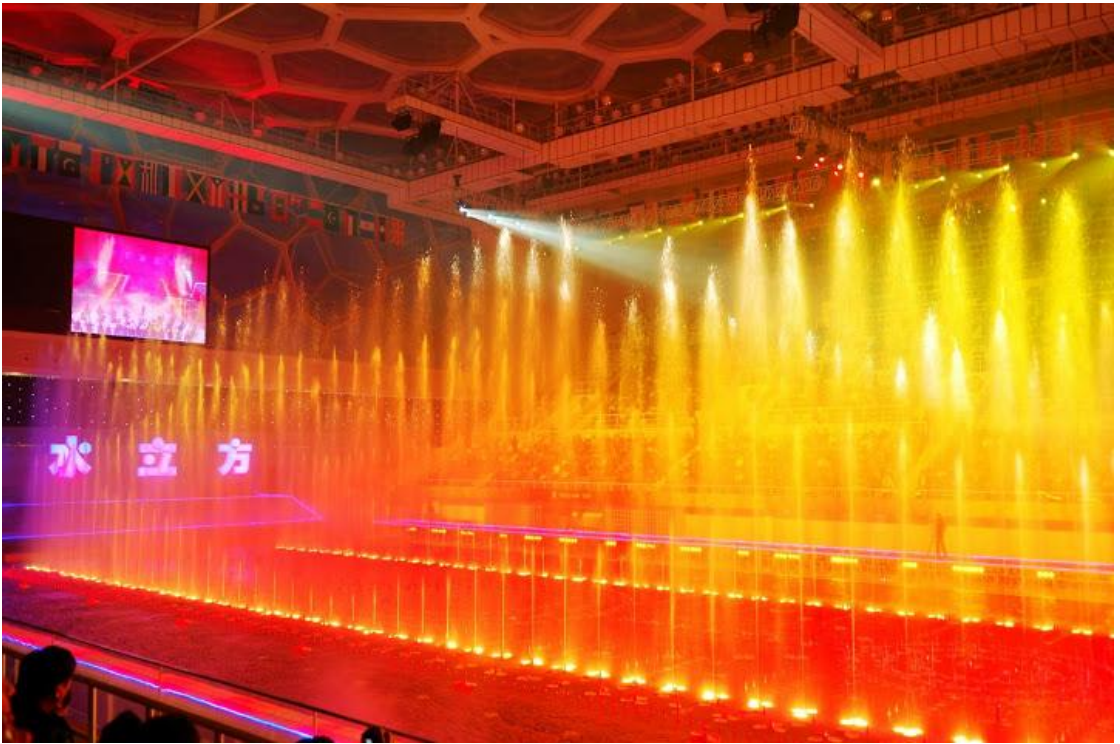
奥运期间的跳水场地。