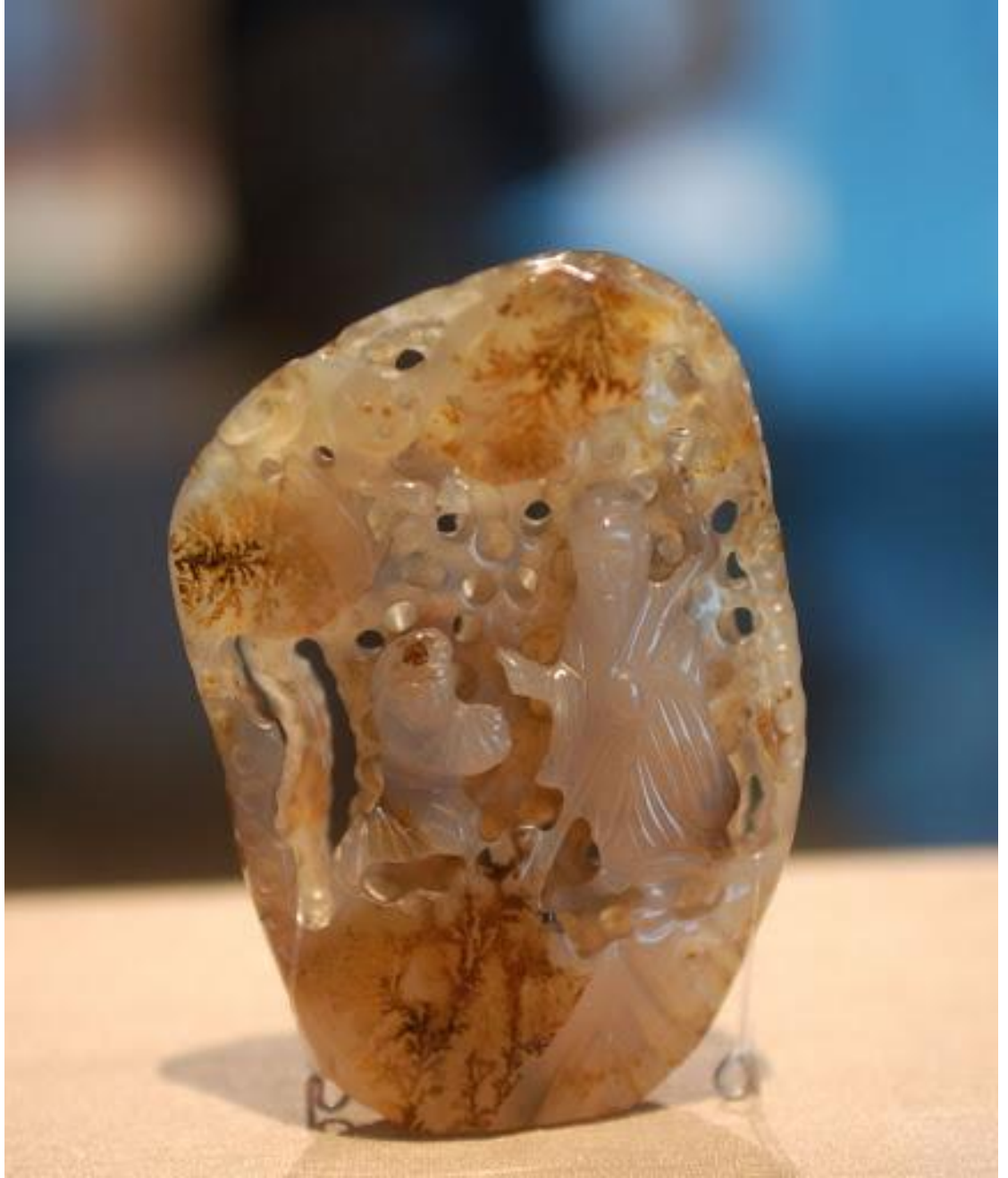
春秋吴国时期的宝贝——古人的审美未必逊色于我们。