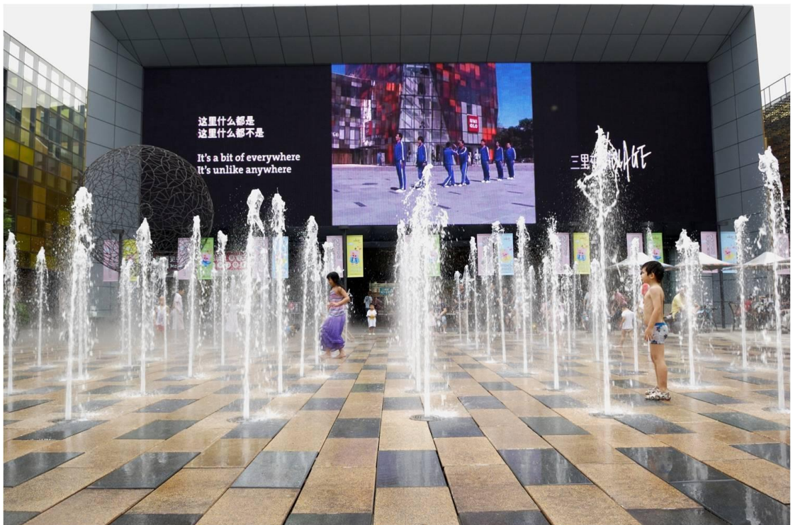
广场后面的巨型屏幕效果很震撼，屏幕下方是一个展厅，正赶上南非使馆宣传到南非旅游的主题活动。看过之后才明白为什么有人不远万里跑到南非去。