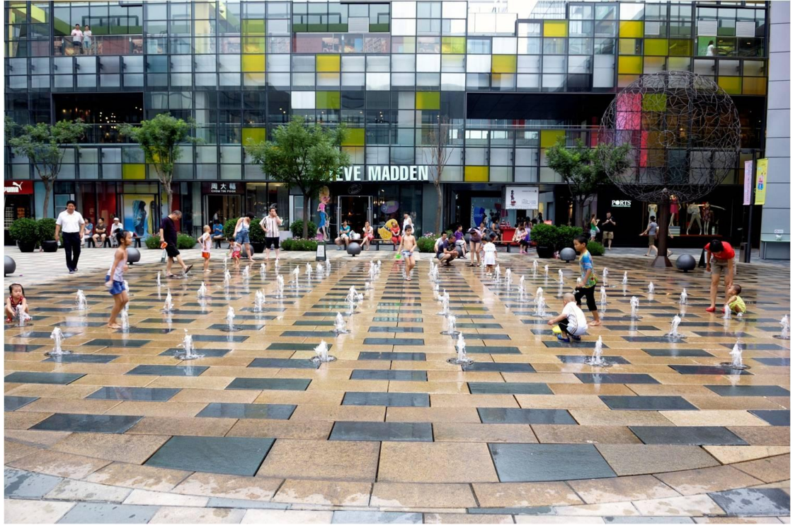
广场的喷水池很讨小孩子的欢心