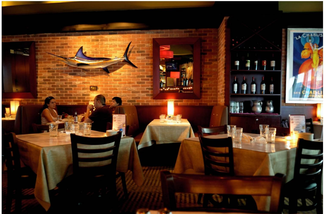
Union美式餐厅，这个名字在美国更像火车站。这家餐厅总体感觉还过得去。